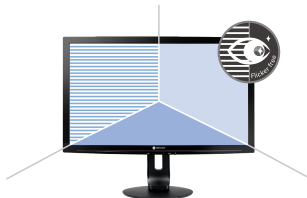
Фильтрация синего цвета

Подсветка с подавлением мерцания и фильтрация синего цвета обеспечивают полный комфорт для глаз, что особенно важно при длительной работе за монитором.